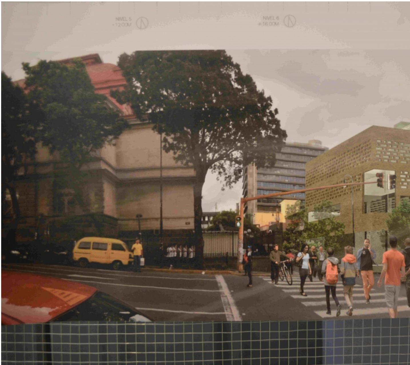
Vista del edificio propuesto desde su costado sur, sobre la avenida segunda.

Vea aquí la noticia de la premiación que realizó el Teatro Nacional [6]