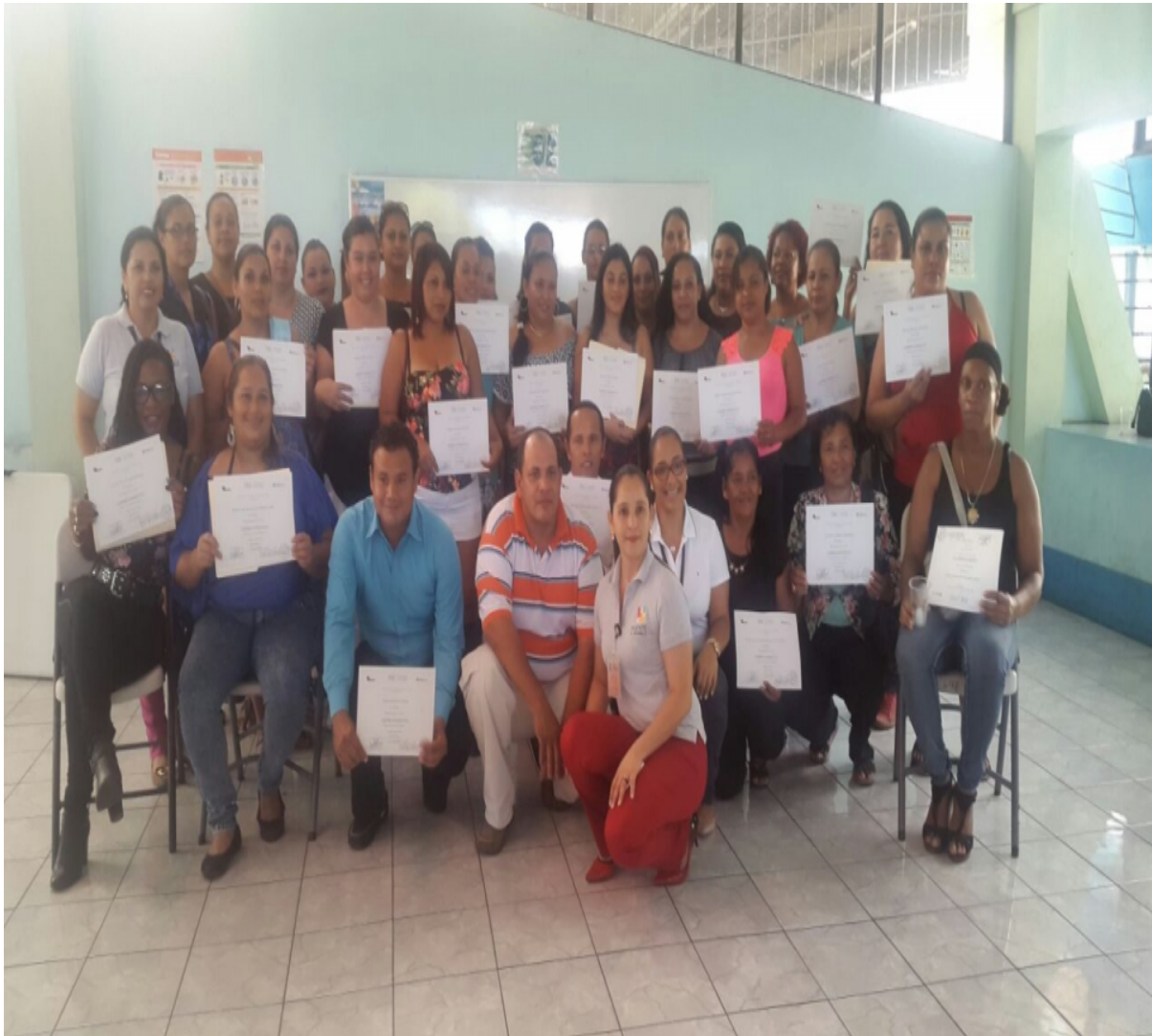
El Centro Académico de Limón hizo la entrega de certificados el martes 14 de febrero.