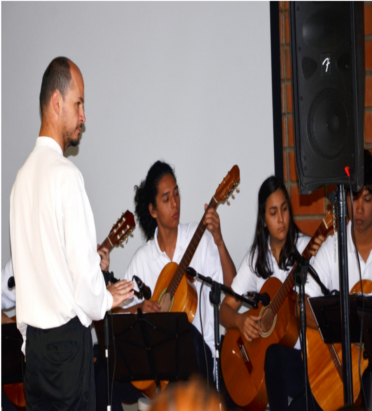
Presentación cultural con la Orquesta de Guitarras en Campus Central, Cartago.