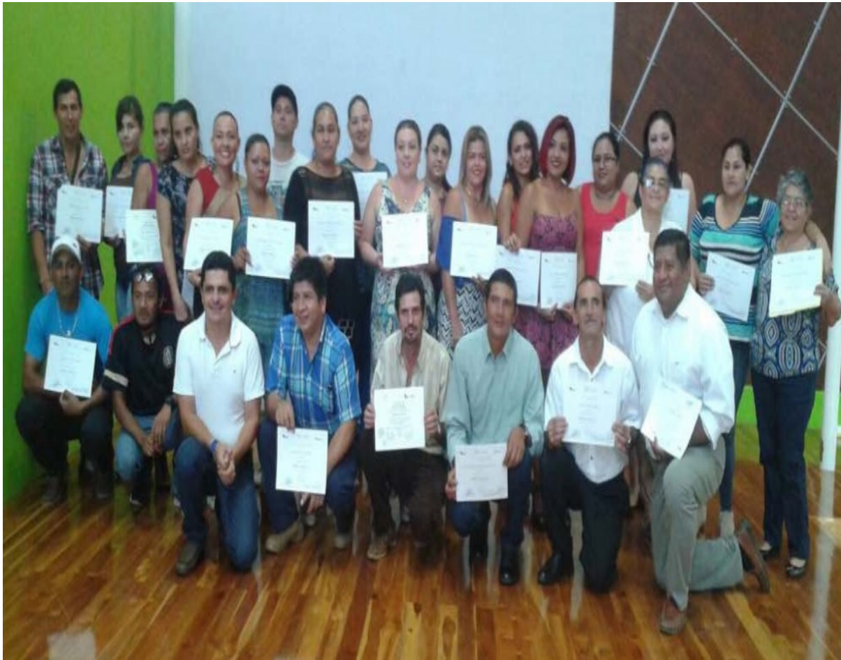
La Sede Regional de San Carlos también formó parte del Emprendimiento: Estrategia Puente al Desarrollo.

Source URL (modified on 04/10/2018 - 08:58): https://www.tec.ac.cr/hoyeneltec/node/1653