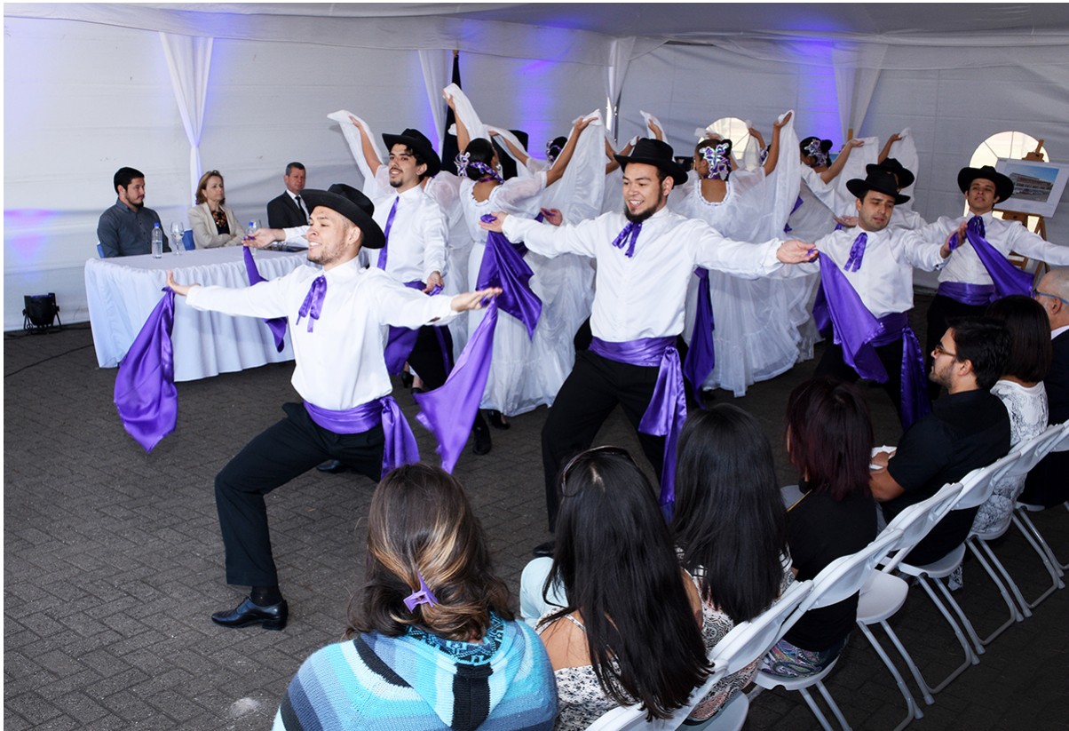
El grupo folclórico Tierra y Cosecha del TEC formó parte del acto que dio por iniciada la construcción del nuevo Comedor Institucional.

Source URL (modified on 04/10/2018 - 08:58): https://www.tec.ac.cr/hoyeneltec/node/1642