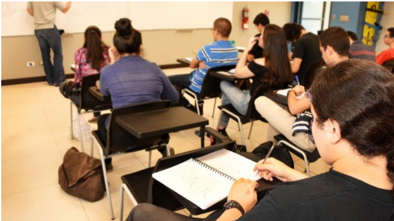
Fotografía ilustrativa