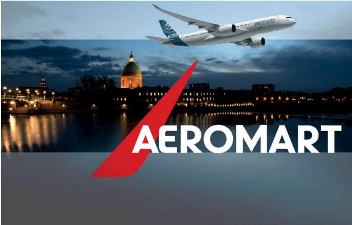
Logo de Aeromart 2016.

En la primera parte del 2016, el Tecnológico aprobó el plan de estudios de la carrera de Ingeniería en Electromecánica con Énfasis en Mantenimiento Aeronáutico [7], lo que ha propulsado la participación de la Institución en diferentes actividades y convenciones de tecnología alrededor del mundo.