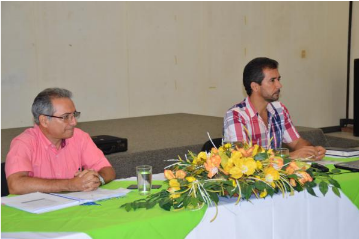
Foro realizado por los estudiantes en el Salón Bromelia.

A las 12 mediodía, el Tribunal Institucional Electoral dio un primer corte. A esa hora ya habían votado 98 personas, lo que representa el 44% del padrón. Las urnas se cierran a las 4 pm y se ubican en el Laboratorio de Biocontroladores. El Director de la Sede electo fungirá en su cargo del 13 de setiembre del 2015 al 12 de setiembre de 2019. El acto de juramentación se realizará el jueves 10 de setiembre.