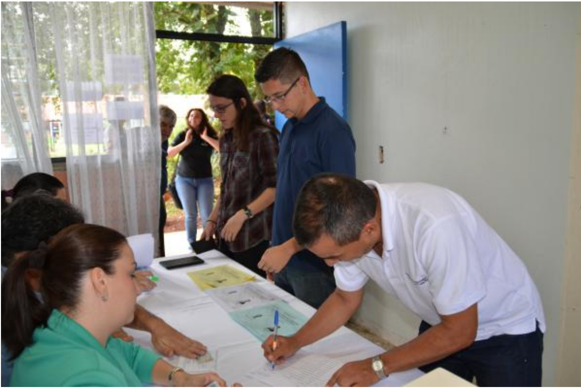
Miembros del CI emitieron su derecho.