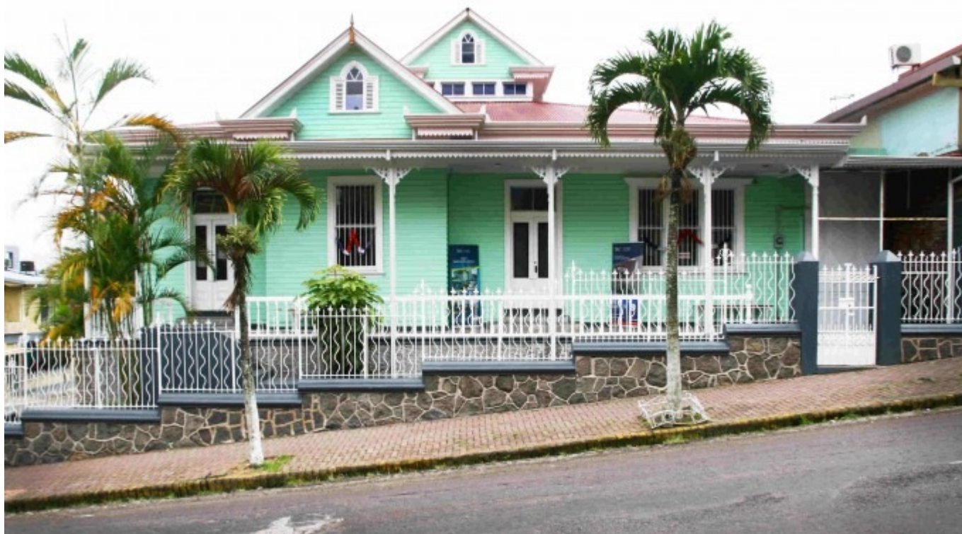
Foto Reportaje: Casa Verde, un recorrido por la Costa Rica de inicios del siglo XX

10 de Octubre 2016 Por: Fernando Montero Bolaños [1]