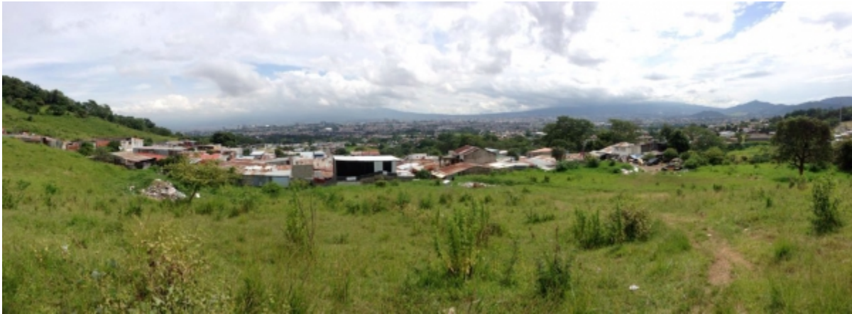
Parte de la vista que tiene la finca donde se ubicará el parque Lalajuelita.