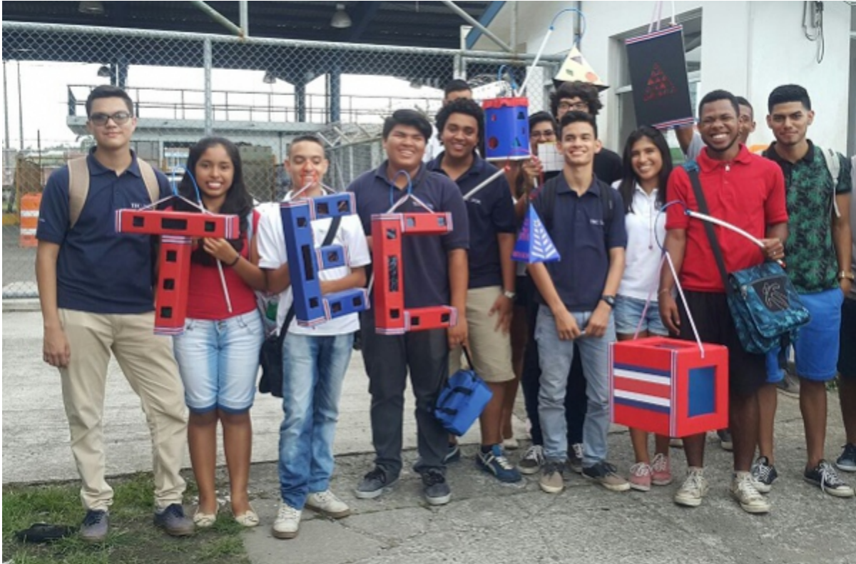
En el Centro Académico de Limón [10] , los estudiantes realizaron un desfile de faroles. En la imagen se observa un grupo de alumnos que elaboró precisamente un conjunto de faroles alusivos al TEC.