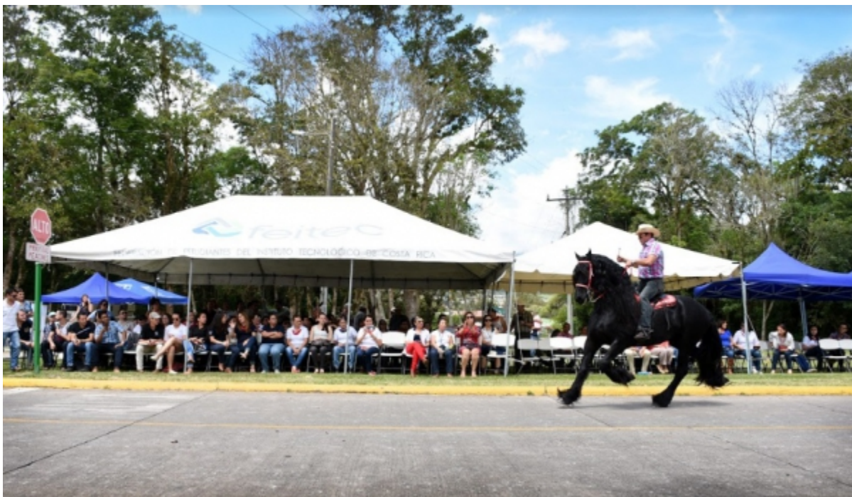
Exposición equina. No todo fue baile y música en el TEC, también se realizó una exposición de caballos, con ejemplares de varias razas que entretuvieron al público presente.