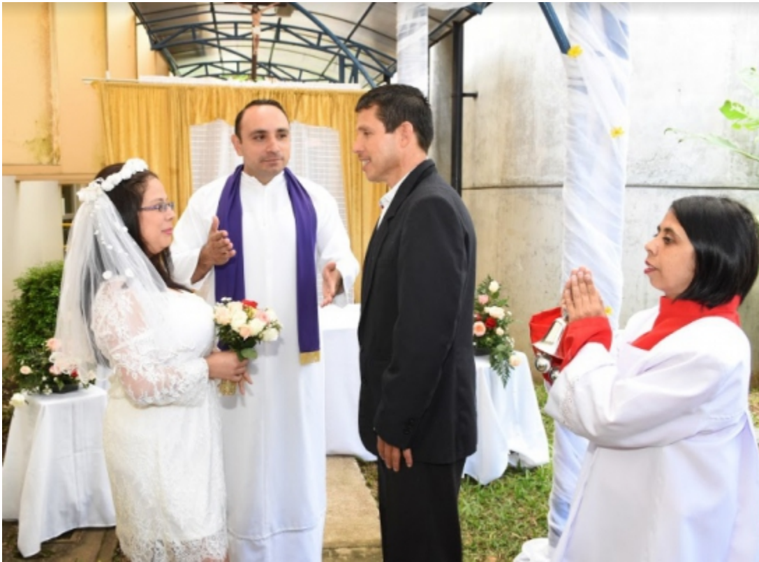
Rincones patrios. Los miembros de la Comunidad TEC en Cartago realizaron espacios con representaciones alusivas a la cultura costarricense. Los funcionarios del Departamento de Recursos Humanos [7] protagonizaron un montaje de la obra “Matrimonio Campesino”, del escritor costarricense Aquileo Echeverría.