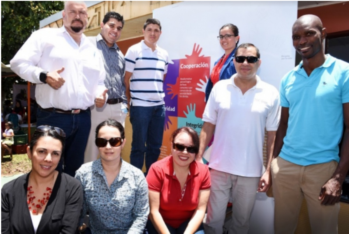
Diferentes grupos de funcionarios del TEC elaboraron los Murales de Valores, que consistieron en la ubicación de dos rompecabezas a gran escala en la Sede Central de Cartago. En la imagen se encuentran los representantes de la Escuela de Agronegocios [5] y de la Dirección de Cooperación [6].