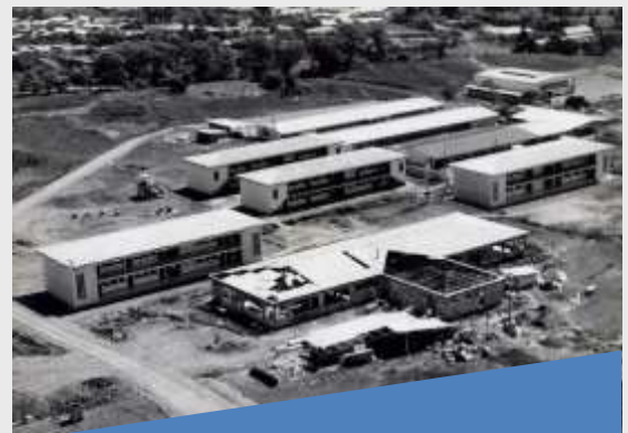
ITCR en sus inicios Campus Central, Cartago

El Instituto inició labores en el Centro Académico de Limón a partir del periodo 2014, acorde a la Reforma del artículo 3° de la Ley N° 6450 del 15 de julio de 1980 y sus reformas. En dicho Centro se imparten inicialmente tres carreras, como lo es Ingeniería en Computación, Ingeniería en Producción Industrial y Administración de Empresas, todas con grado bachiller. La misión del Tecnológico de Costa Rica es fortalecer y potenciar las capacidades de los habitantes de la zona del caribe por medio de educación de calidad a nivel